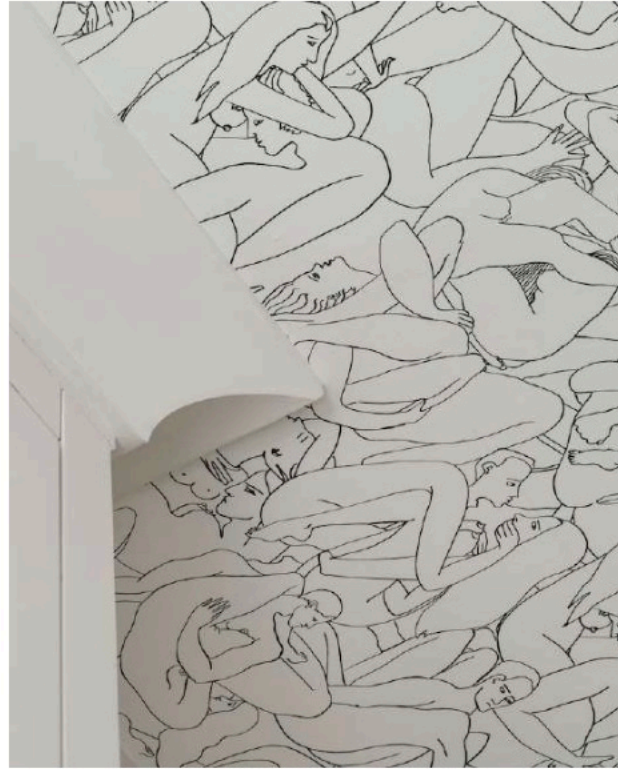
A la izda. lámpara hecha a medida de la galería milanesa Nilufar sobre una mesa de piel. A la dcha., papel pintado de Pierre Frey.

de madera natural personalizados con showroom en Londres y en Nueva York. En la sala de estar, el esquema de color se inspiró en gran medida en la paleta de la pintura que cuelga sobre la repisa de la chimenea, firmada por la británica Flora Yukhnovich, que suele experimentar con la estética rococó y le añade una mirada contemporánea, aportando lienzos casi abstractos y densamente empastados. El azul reinante en el cuadro encuentra su réplica en la alfombra y en los sofás.