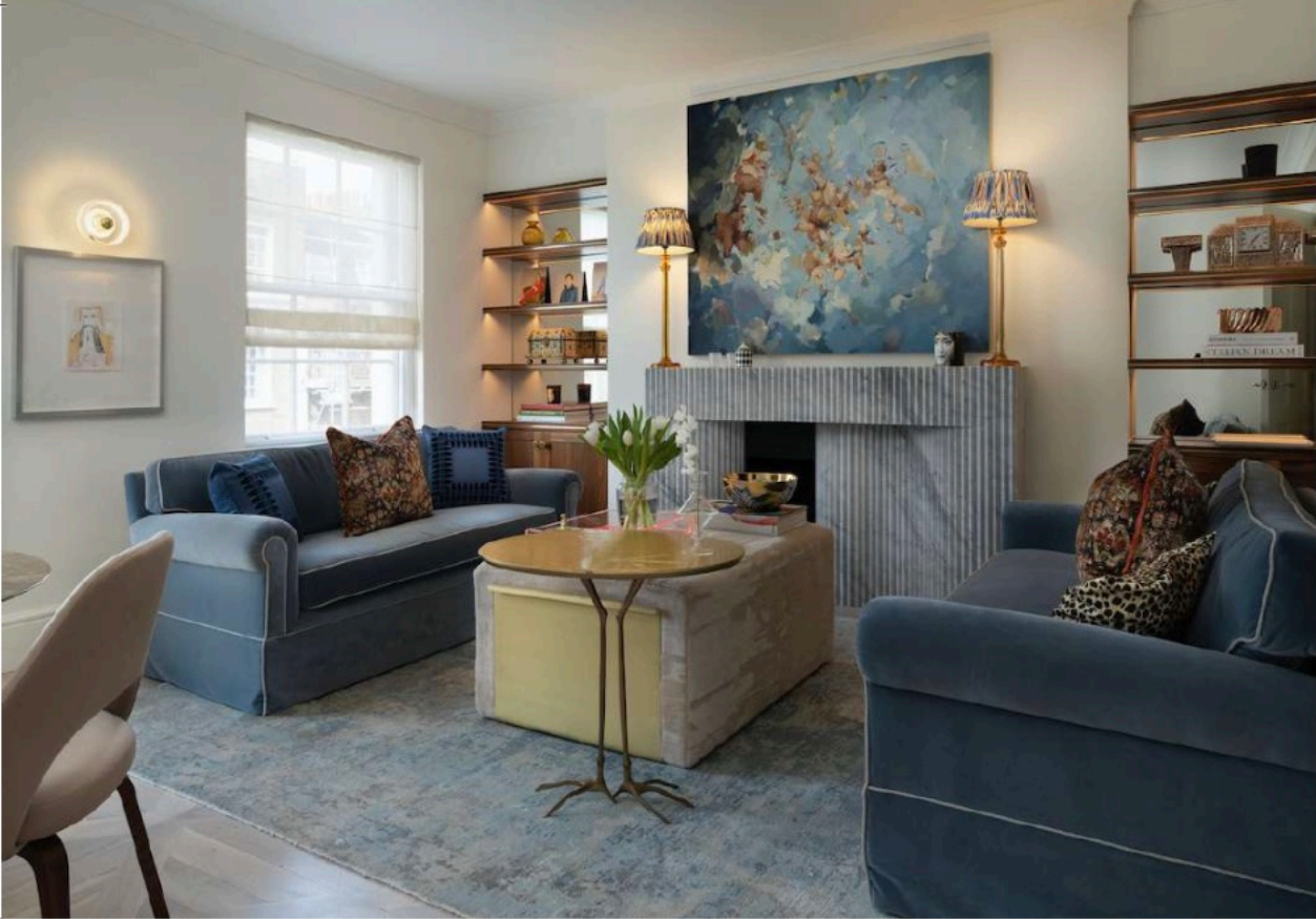
En la sala de estar, el esquema de color se inspiró en la paleta de la pintura que cuelga sobre la repisa de la chimenea, firmada por la británica Flora Yukhnovich.