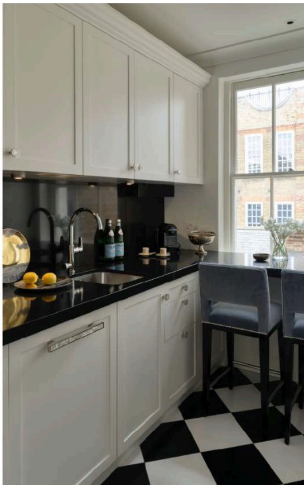
A la izda., detalle del suelo de uno de los baños. A la dcha., la cocina, que dispone de una barra de desayuno.