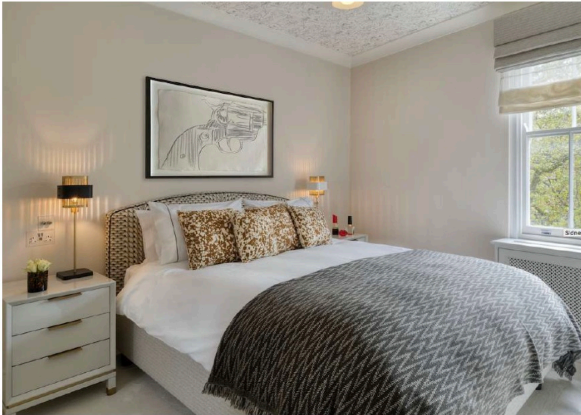
Sobre la cama del dormitorio principal, una obra de arte de Andy Warhol hace un guiño a los antecedentes industriales de la familia.