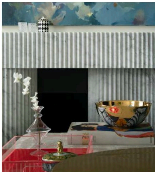
La chimenea ondulada la construyeron en Tomèf.

EL CUADRO MANDA La luz entra a raudales por las ventanas del apartamento, así que tanto la luminosidad como el arte se tomaron como punto de partida para su esbozo. El estudio replanteó el flujo del espacio, concibiendo un salón más grande que el existente, crucial para establecer un tono acogedor y holgado. “Aunque es un piso pequeño, la introducción de un vestíbulo mayor hace que parezca mucho más grandioso de lo que es, y nos permitió separar las áreas de estar de las de los dormitorios privados”, dice Tommaso Franchi.